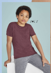
REGENT FIT KIDS 01183