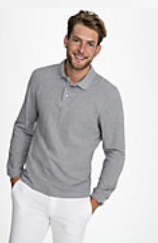
SOL'S WINTER II 11353